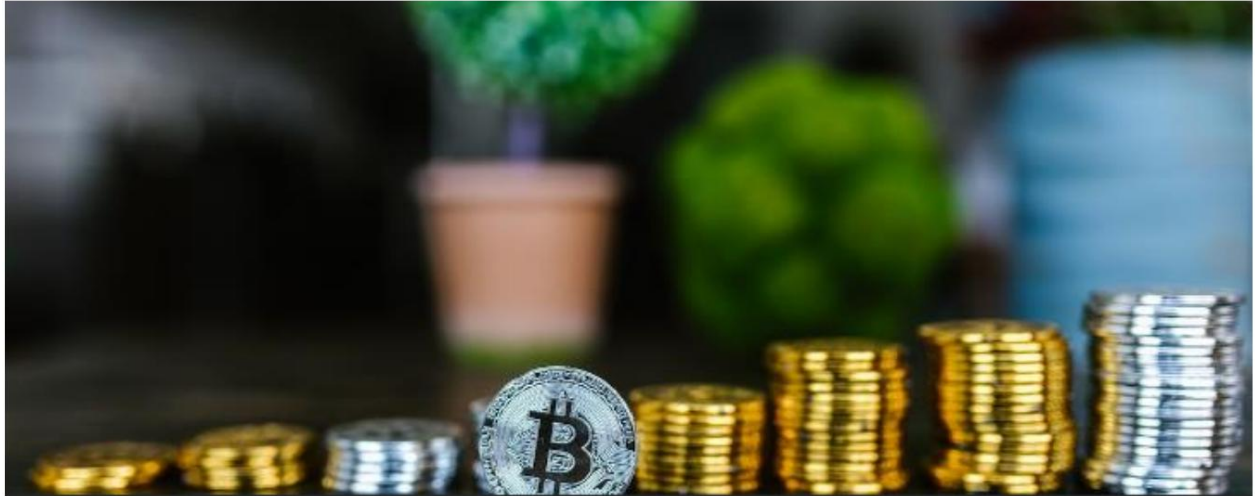
Kryptowährungen und digitale Vermögenswerte

Wir bewegen uns an der Schwelle des Finanzwesens, indem wir strategisch mit führenden digitalen Vermögenswerten wie Bitcoin und Ethereum handeln und ein diversifiziertes Portfolio halten. Unser Ansatz vereint langfristiges Wachstumspotenzial mit aktiven Handelsstrategien.